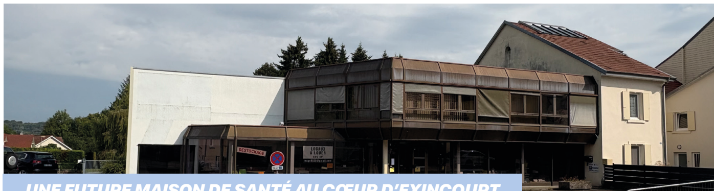
UNE FUTURE MAISON DE SANTÉ AU CŒUR D'EXINCOURT